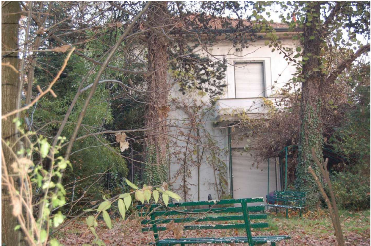
Prospetto lato ovest