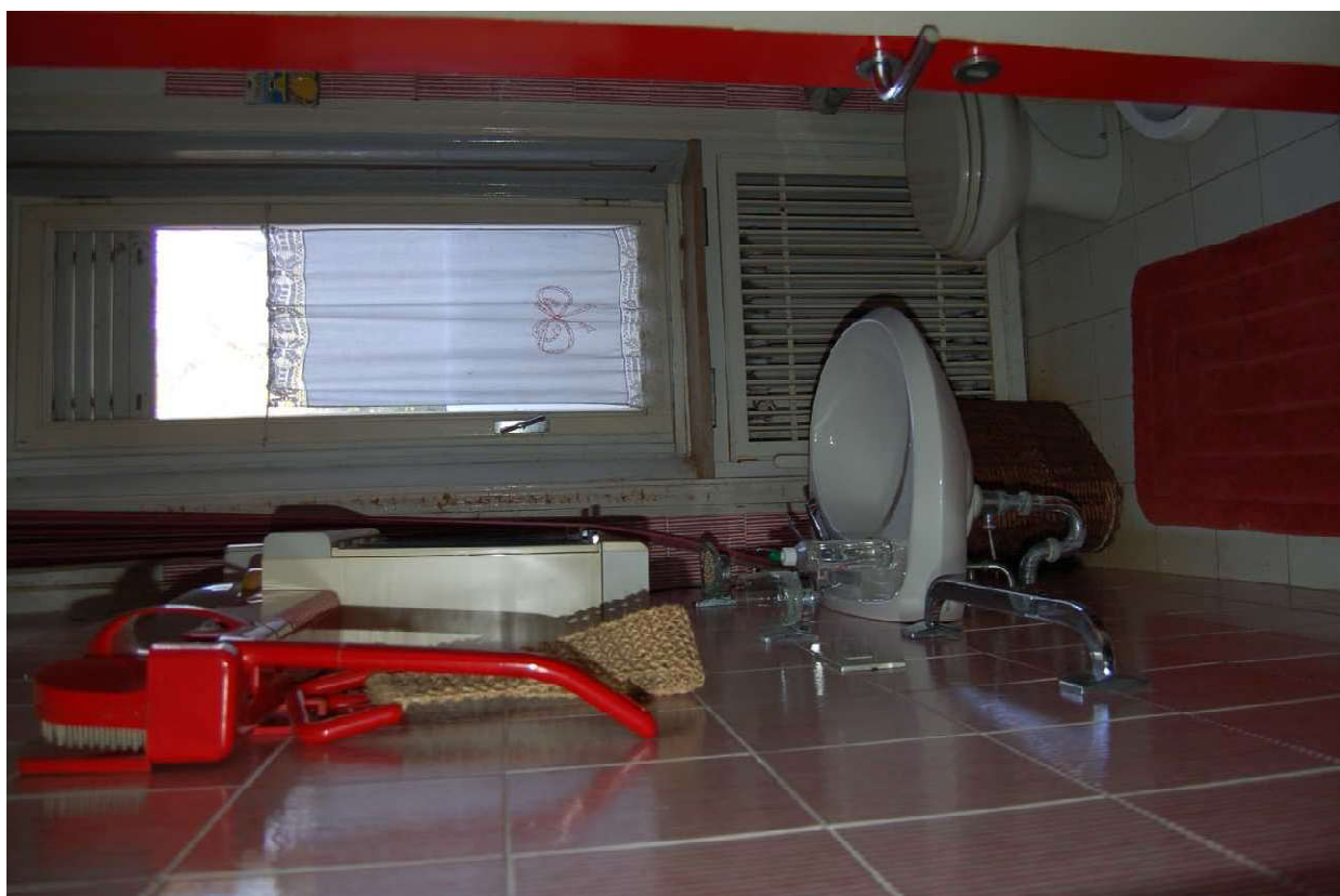
Bagni a P.T.