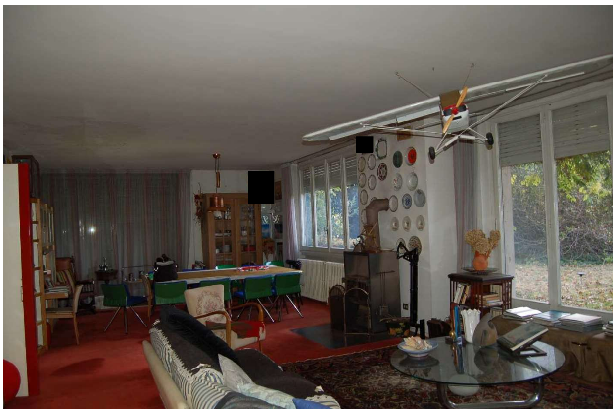
Soggiorno - pranzo