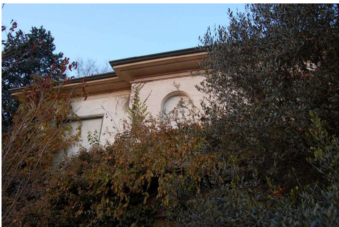
Prospetto principale – lato sud